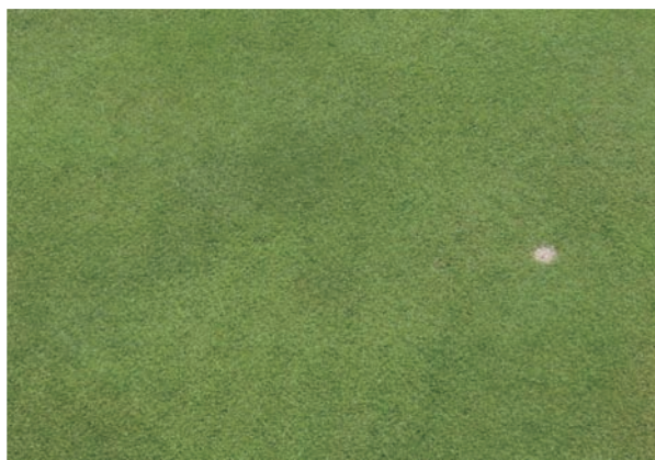
サンブロッカー使用区

ここ数年、温暖化の影響もあり夏場の日中にベントグリーンが高温及び乾燥で葉の表面が黒くなり枯死に至る症状を多くのゴルフ場で見受けます。この原因は、植物に有害な紫外線による葉焼けと過剰な蒸散が挙げられるのではないのでしょうか。サンブロッカーは酸化チタンとUVカット着色剤を配合しており、ベントグラスやコウライ芝の日差しによる葉焼けと葉の表面の乾燥を防ぎます。